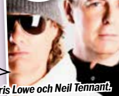
Chris Lowe och Neil Tennant.

V i ses när dagen gryr på en bilskrot i Huddinge. Orup har dåligt morgonhumör och kallar sig gringubbe, men i dag pekar mungiporna snett uppåt. Kaffet ryker i den isiga timmen och vi stövlrar runt i minnen. På sitt comeback-soloalbum från 2010 sjunger popmästaren: Jag är född i november, på morgonen i dagens rand. Just på gränsen till kalla december, när kylan var hård i vårt land.