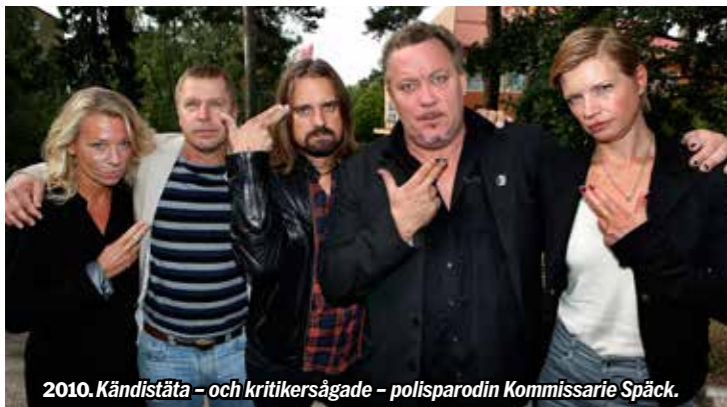
2010. Kändistata – och kritikersågade – polisparodin Kommissarie Späck.

– Den här stassen köpte jag till premiären av Kommissarie Späck , säger han och greppar kavajslagen.