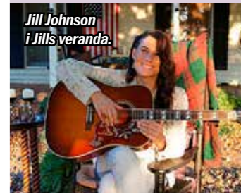
Jill Johnson i Jills veranda.

... Jill Johnson. Jag är kär i Jill. Det var inte kärlek vid första ögonkastet, inte sån typ av kärlek. Men jag älskar det hon har gjort för mig. Hon har gett mig allt det här och jag är henne evigt tacksam.