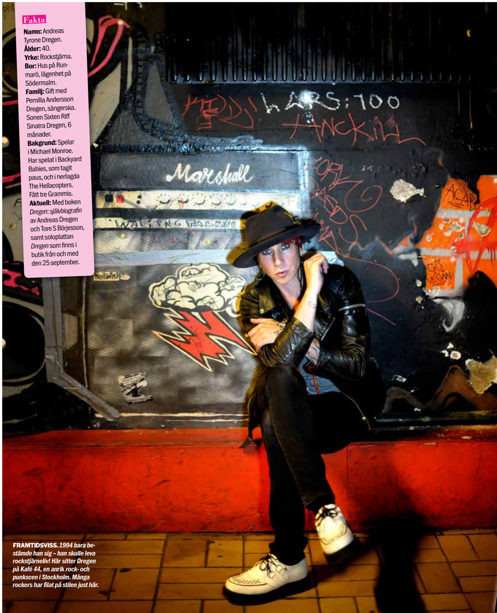
FRAMTIDSVISS. 1994 bara bestämde han sig – han skulle leva rockstjärneliv! Här sitter Dregen på Kafé 44, en anrik rock- och punkscen i Stockholm. Många rockers har filat på stilen just här.