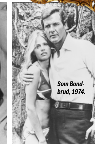
Som Bondbrud, 1974.

Ceasarsalladen står orörd framför henne på ett silverunderlägg. Chihuahuan Tequila har somnat i sitt kuddberg med den lilla magen vänd uppåt. Britt Ekland har pratat i en halvtimme utan att hämta andan. Nu gör hon det. Lutar sig tillbaka och säger: – Det var min introduktion till marijuana. Och till Peter Sellers. Sedan tar hon en klunk av rosévinet. Diamanterna på högerhandens ringar gnistrar i hotellsvitens belysning.