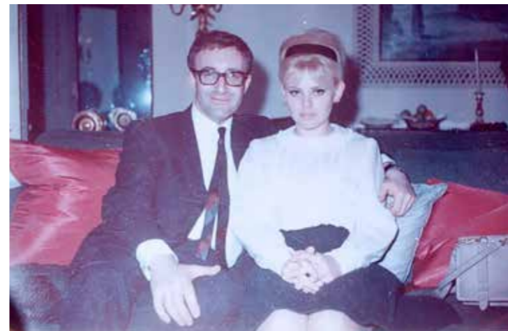
Med blusen knäppt ända upp till halsen, träffar Britt Ekland sin blivande make Peter Sellers för första gången. Och introduceras för marijuana.

na rädsior. Det är sådan jag är bara. Om man inte är sådan kommer man ingen vart och det insåg jag tidigt.