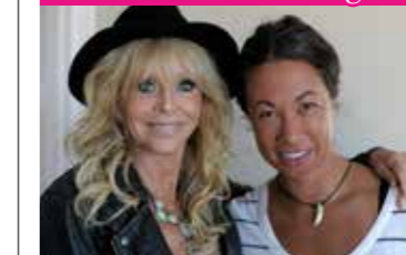
Inför mitt möte med Britt Ekland trodde jag att hon inte skulle vilja prata om annat än yta, men när jag väl fick sitta ned med henne visade det sig vara tvärtom. Då kom det att handla om pappa som aldrig fanns där, mamma som fick alzheimers och livets konstiga vägar.