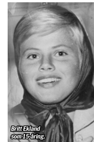
Britt Ekland som 15-åring.